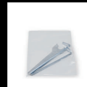
sacchetto accessori accessories