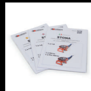
manuale d'istruzioni multilingua Multilanguage instructions booklet